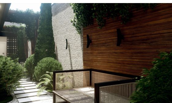
JARDIM DE INVERNO

Acompanhamento da obra com visita técnica semanal, assessoria entre profissionais e fornecedores e cronograma de execução de obra atualizado e apresentado entre as partes.