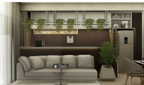
ÁREA SOCIAL INTEGRADA

Vistoria presencial e formulação do Laudo Técnico de Habitabilidade, Sustentabilidade e Segurança.