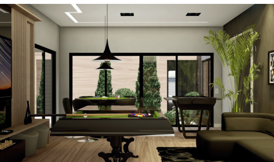
SALA DE JOGOS