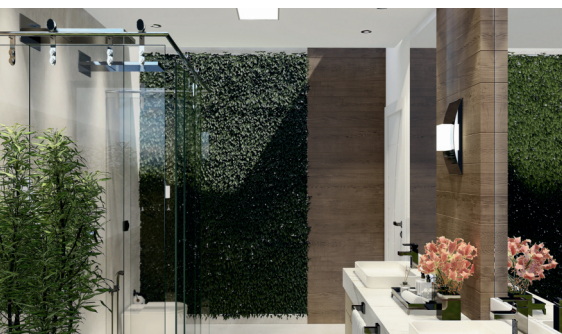
BANHEIRO COM BIOFILIA